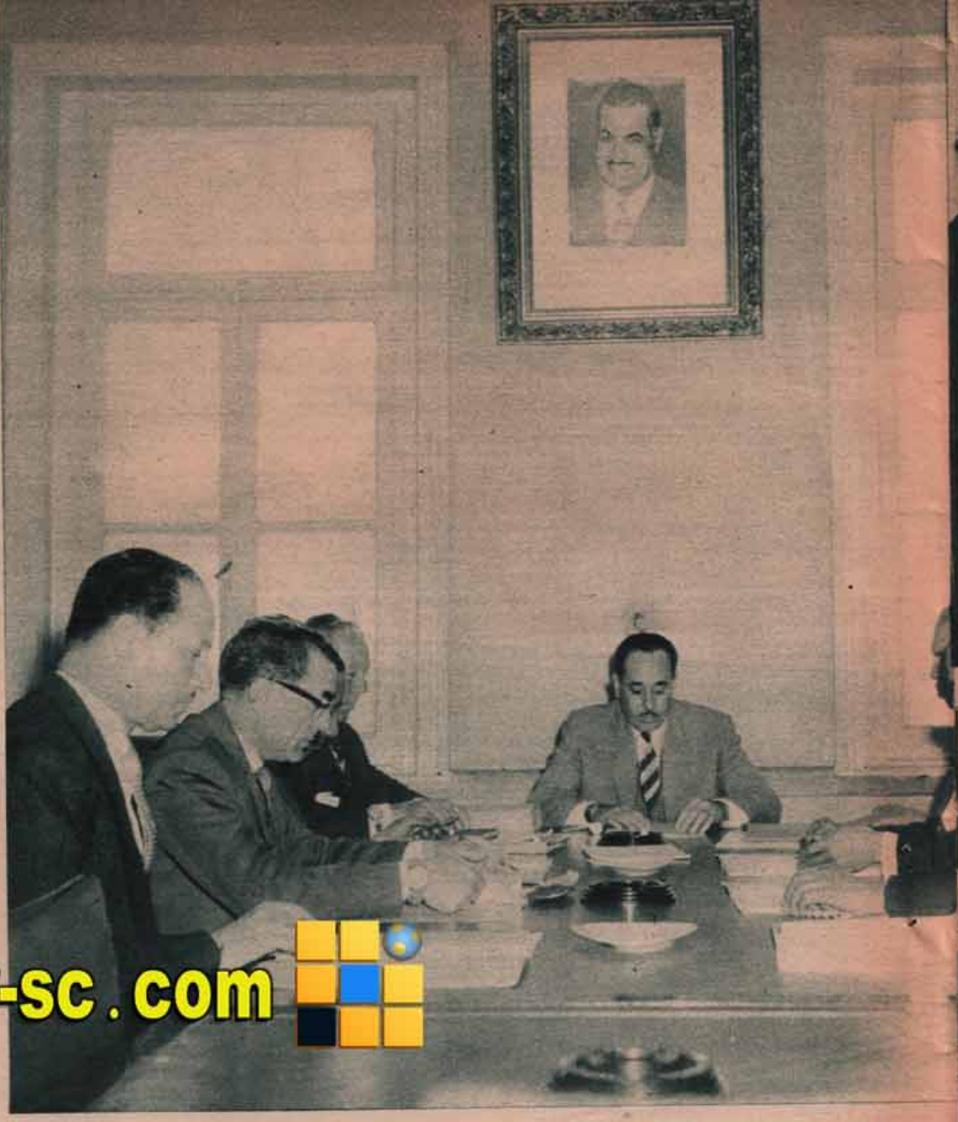
التادى العمل .. ومن حوله اعضاء مجلس الادارة المؤقت .. جئنا انفسهم طول الاسبوع لبعث الروح في اللاعبين .. وفي النادي ..