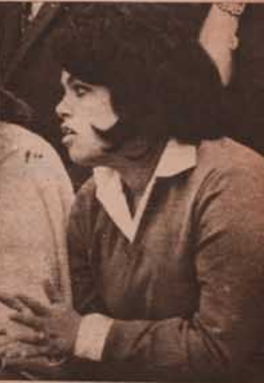
خلاص ضاع الماتش !