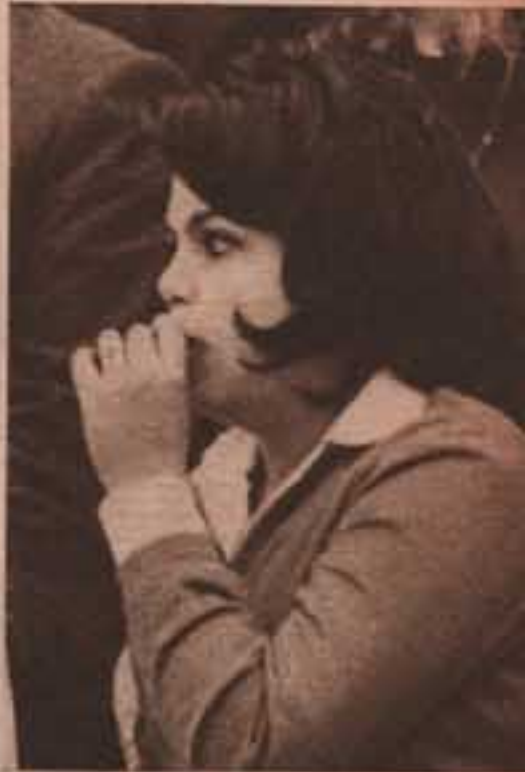
لو كنت رجل حمادة ..