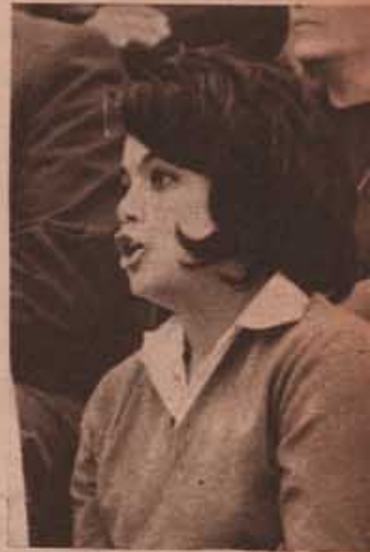
شوط يا نصحي ..