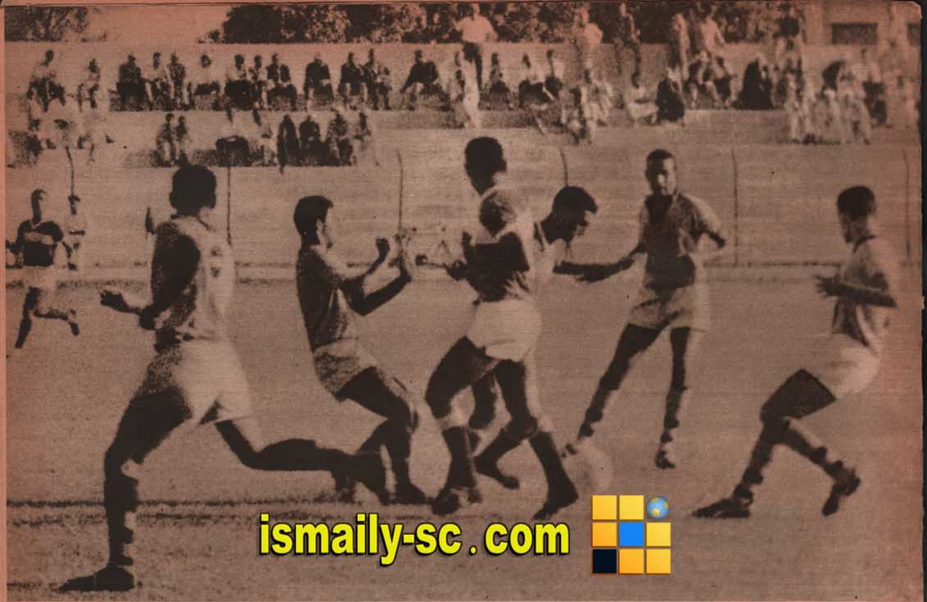
الكرة مع حرب لاصية الترسانة ، ويجواره زميله التسادلي ، احاط بهما يسرى طربوش والسقة من الامام .. والسيد حامد وميسى ودويش من الطلف ..