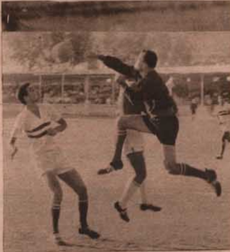
زعت حارس الاتحاد يمد الكرة بقبضة يده ..