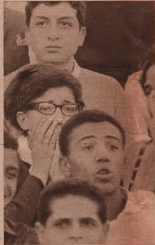
.. وعش البيض أصابعه !