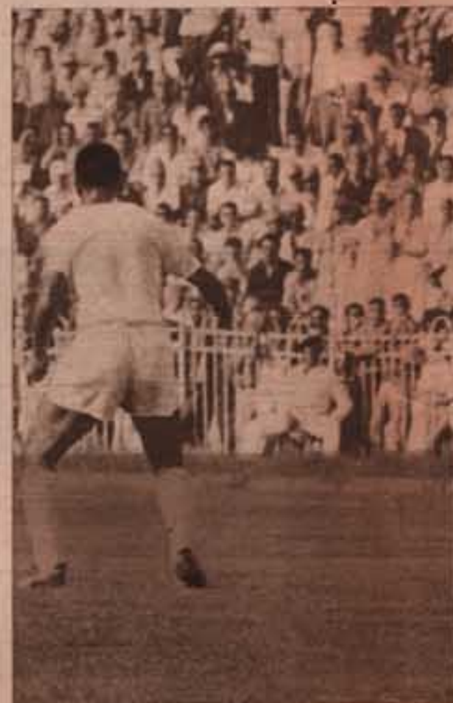
.. والكرة بعيدة عن الاثنين ..