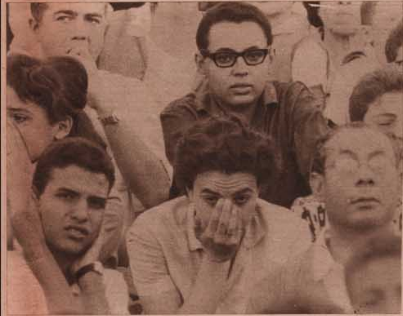
الخشونة + العرض السيء اثارا اعصاب اعضاء الامم .. اذار البيض وجهه