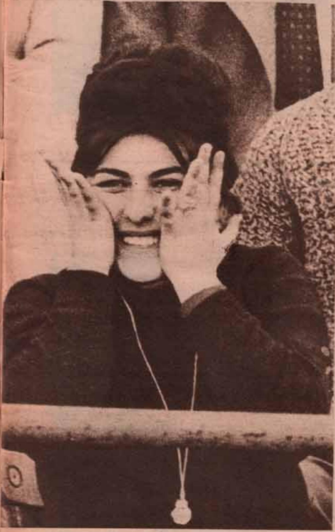
خوف انقلب ال فرح .. على وجه شقيقة لانا لاعب الامل ..