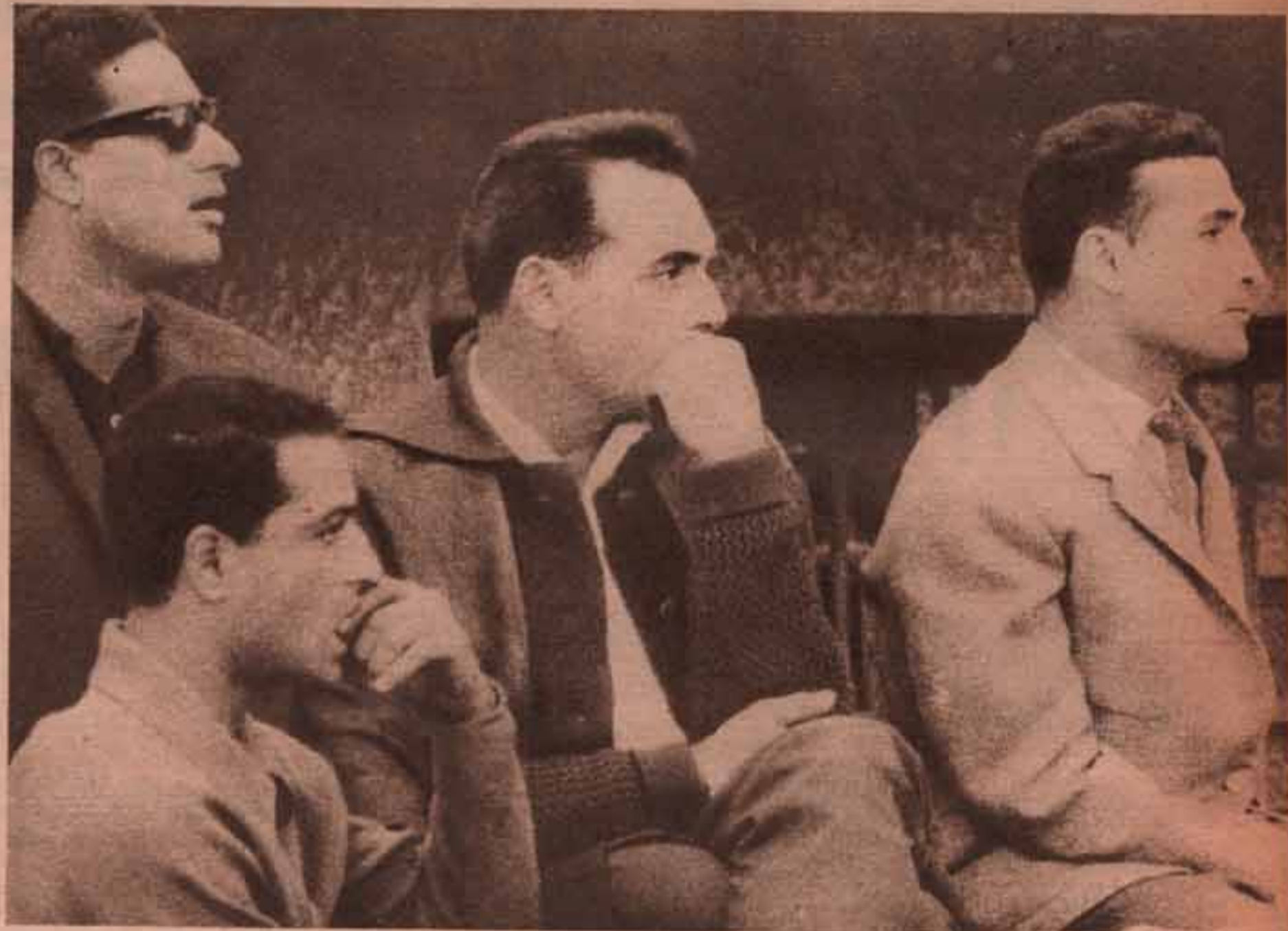
ناب الزمالك فانزا على الترسانة ٢ / صفر .. ومع هذا لم يطمئن نصحي ورفاعي والدو وعفت على النتيجة ...