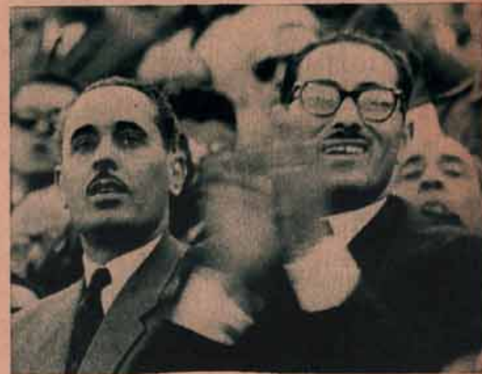
تم هاجم الاهل في الدقائق الاخيرة ..

وبدا الاهلى يطبع تذاكر المباراة .. سعة مدرجات الدرجة الثالثة ٢٨ الف متفرج .. كان مقررا ان يكون سعر التذكرة ١٠ قروش .. في المران الاخر للنادئ الاهلى قبل المباراة شاهده التدريب ٢٠ الف متفرج ، وشاهد