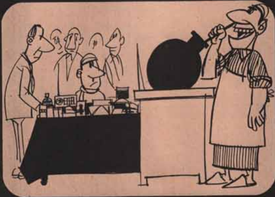
- وانا كمان عنسدى الفول بتاع غزة ١٠٠