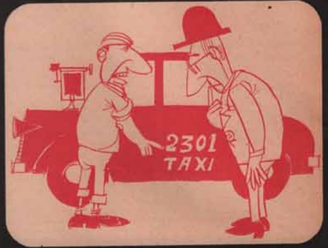
- ماتقرا العداد كويس ياخواجه ١٠٠