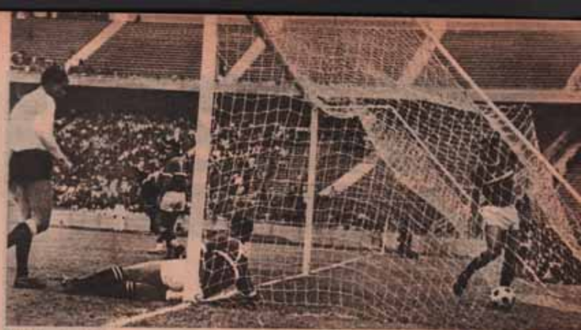
هدف ليبيا الاول