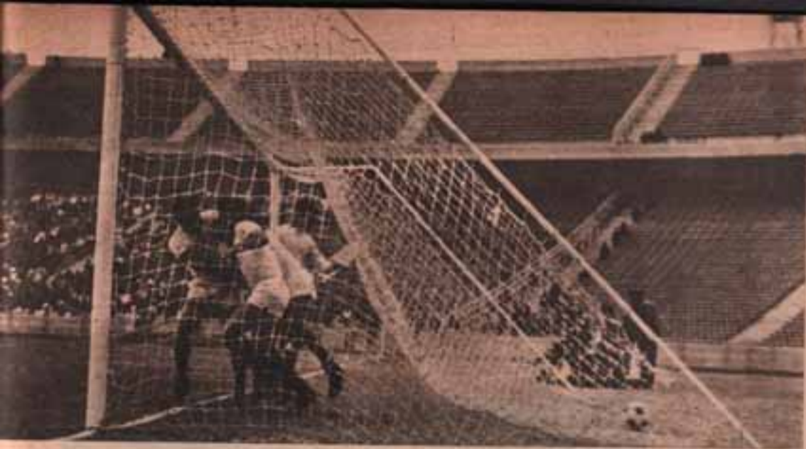
هدف ليبيا الثاني