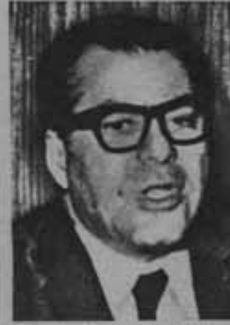
اللواء محمود السباعي