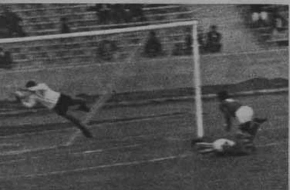
خمس لقطات .. لخمسة اهداف ضائعة .. ويلاحظ ان هشام