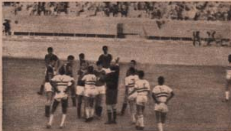
ولكن الحكم ظن انه يشده من حيمه ومن شارته الدولية ، فدفعه يديه وحاول لاعبو الزمالك القيام بدور الخلفي