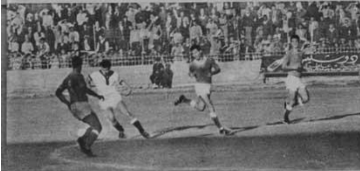
ملا تقي امام محمود حسن ليودع الكسرة المرمى ؟ سقط الحارس واصبح المرمى مفتوحا ومع هذا .. لم يسجل محمود!