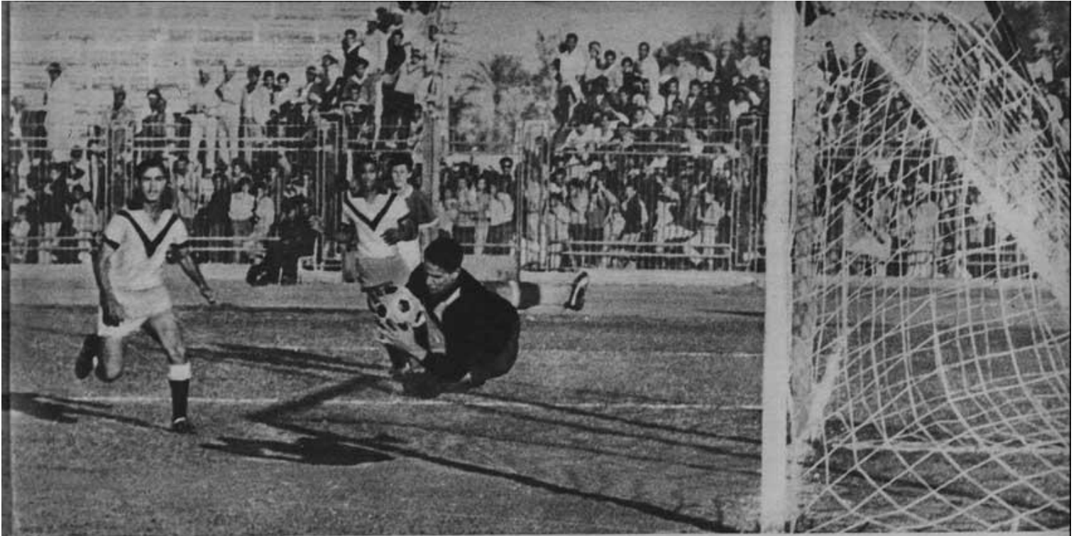
لاعب من سراييفو « بلم » الكسرة بطريقة جعلتها ملكا له دون غيرت ابو الروس .. لم حركة شبيهة بهوانية لاحد لاني انتراحت ..