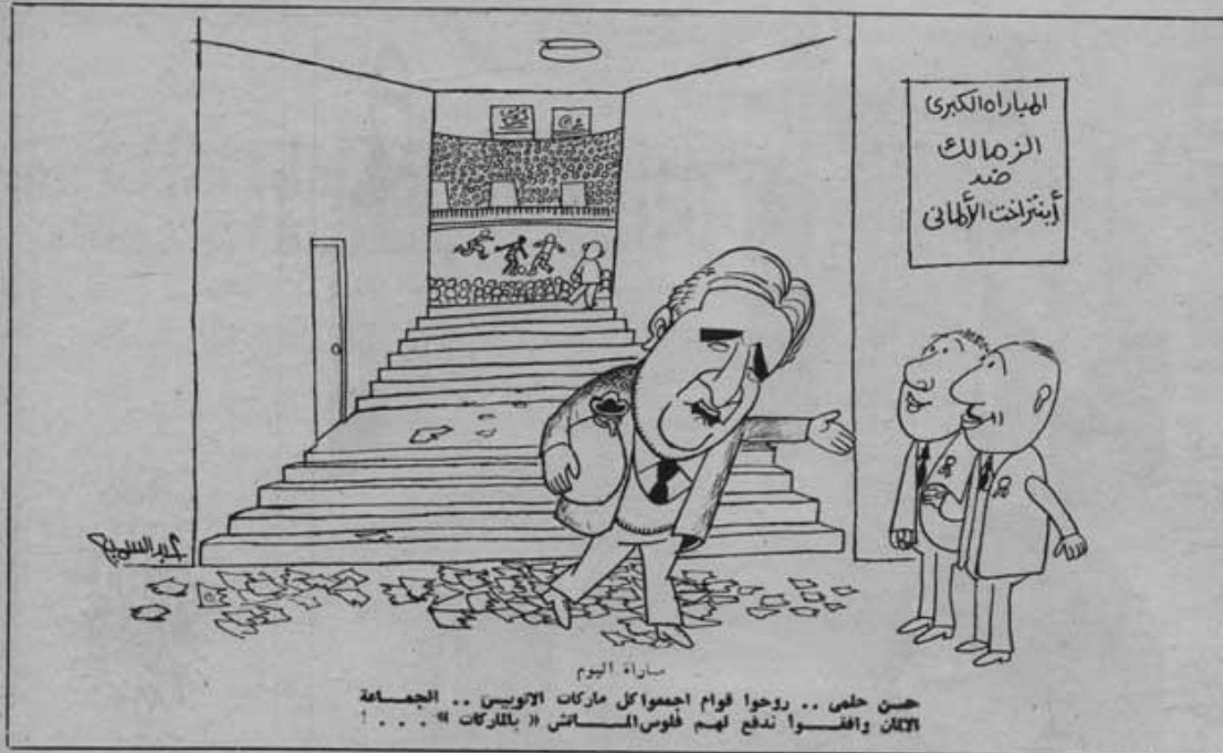
ساعة اليوم حسن حلى .. روحوا فوام اجموا كل ماركات الاوتيس .. الجماعة الاتان وافسوا ندفع لهم فلوس الماتش « بالكراتات » ..