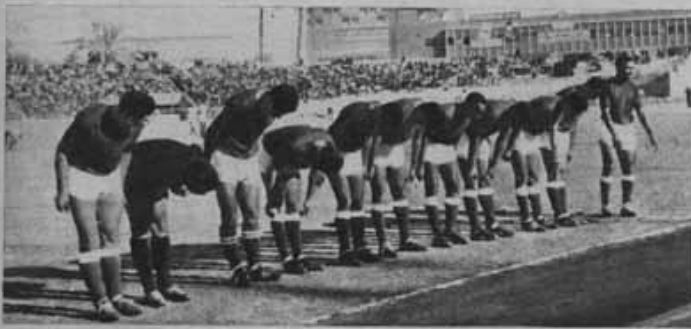
لماذا يحظى لاعبو الاهلى روسهم هكذا ؟ .. ان اسماة ومن قبل صالح سليم وفسأ ان يحنيا راسيها .. ارجو ان يطلع الاثيون عن هذا المثل القرية