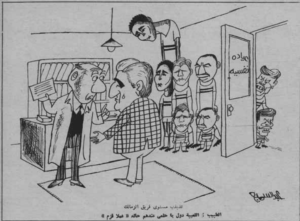
تدريب مستوى فريق الزمالك الطبيب : اللعبة دول يا حلمي متدهم حاله « عيلا قزم »

اصحاب نفت في فترة ما بين الشوطين وتبنيه الى عدم ارتكاب أى خطأ قد يؤدي الى طرده .