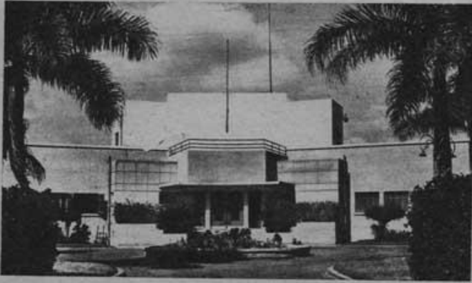
مبنى المركز الاجتماعي للشركة وبه نادي المالية الرياضي بقرى الرياض

تولي الشركة اهتماما بالغا بالنشاط الرياضي .. لما للرياضة من أهمية كبيرة في بث روح النشاط والخلق الرياضي بين العاملين بها ولهذا أنشأت ملاعب لأهم الألعاب الرياضية وهي : ملاعب كرة القدم بالدرجات - ملعب باسكت - ملعب فولي - صالة بيج بيج صالة بليارد - حلبة ملاكمة - حلبة مصارعة - حلبة جودو - ملعبان للتنس - حمامات سباحة للرجال - حمامات سباحة للأطفال . وفريق كرة القدم بها هو من الفرق الصاعدة حيث يشترك الدوري العام للدرجة الأولى . وتعمل الشركة على تشجيع العاملين بمسائل الاشتراك في الألعاب الرياضية وتعمل على إقامة مسابقات تدريبية وعرضي السلام الرياضية واجتماعية بدار السينما الموجودة بالنادي .. والشركة ترحب بتسليم الشباب الرياضي من المدارس والشركات والهيئات الأخرى لممارسة أي لعبة يرغبونها بالنادي مجاناً