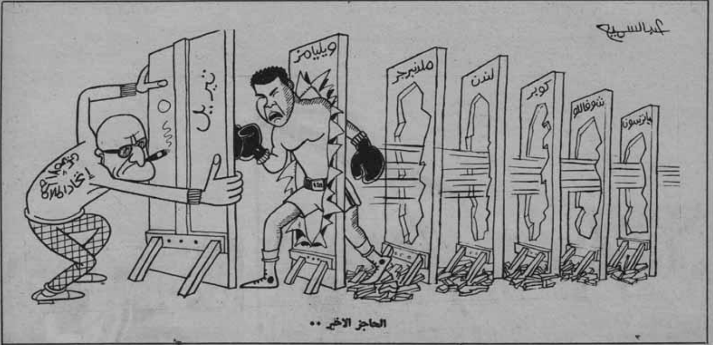
العاجز الآخر ..