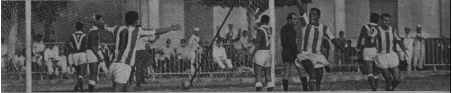
معلم هجمات الاهلي على الطيران لم تشر لولا ابو عيده الذي خطف للاهلي التقطنين ...