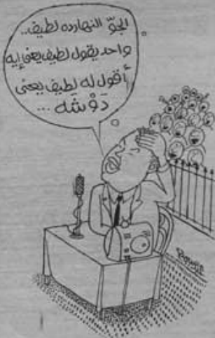
عيد السبع يدع مباراة عن نفسه