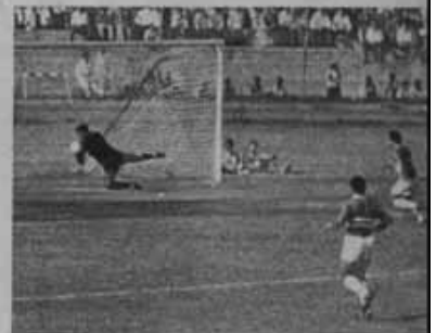
جوم اوليمبي على مرعى المصرى فى البسارة الفائزة التي اقيمت بينهما فى الاسكندرية وانتهت بفوز الاوليمبي بفضل تحركات عز الدين