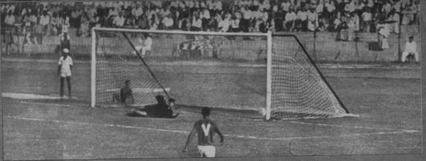
الهدف الاول للاهلي .. الكرة تدخل المرمى كالصاروخ وموسى يحارس السكة بعد محاولة هاشية لصدها