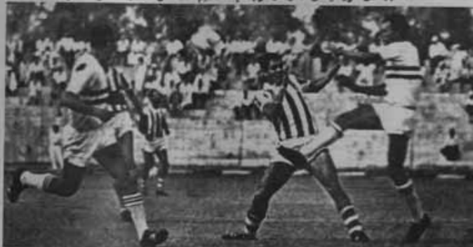
المجوز يكن يشتت الكرة في لياقة تامه