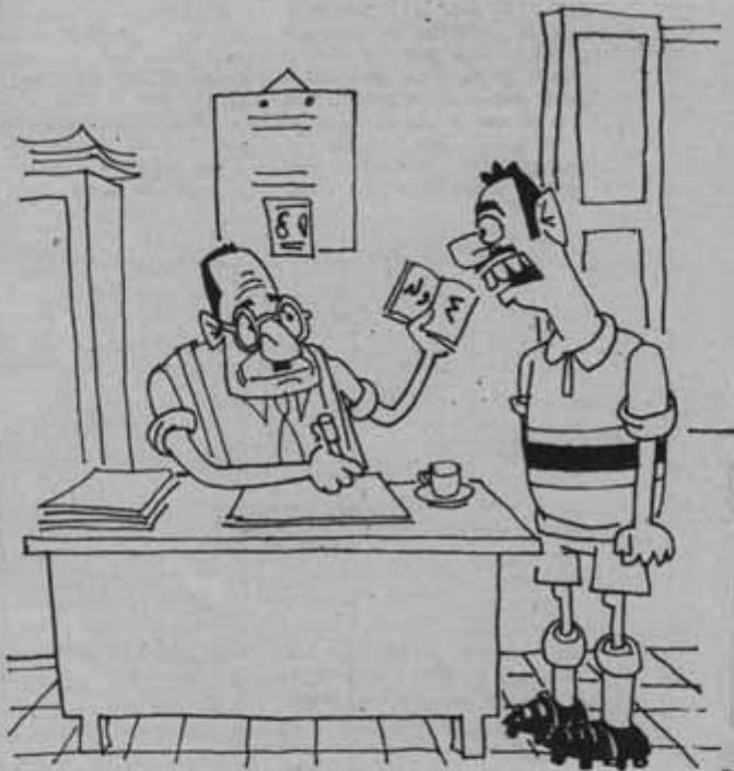
والله بابيه مشى ٦ خيال بس فيهم التبراحتيال !!