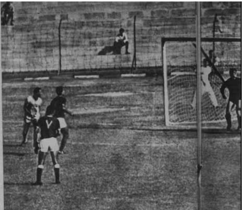
ناديتش يطار بجنى بعد الهزيمة