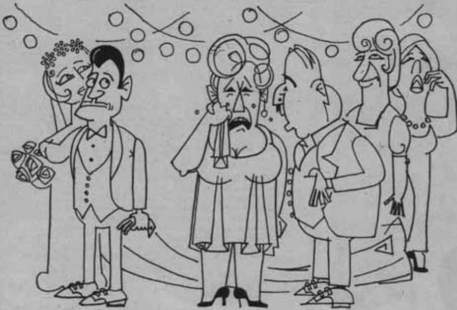
دى مش دعوى الفرح ... دنا زلانة عشان حابسلوا اسمها من بطاقة التهنين !!