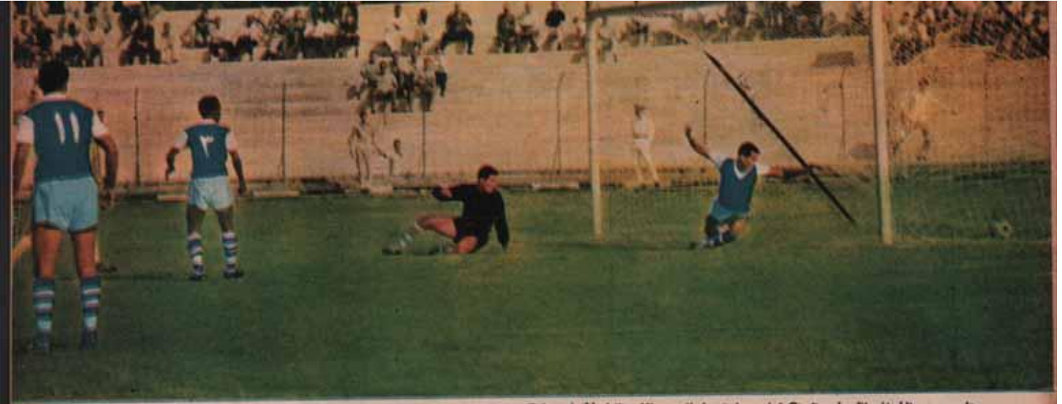
حارس مرمر الطيران ينتظر بامس ال الكرة في مرماه - واسفل سورناتن - الاول لله في محاولة مجتهدة لاجراز هدف - والاخرى لرفضا بعد هدلا من اقدم حسن جبر