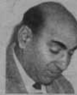
بمقلم محمد لطفى

كلها هزم فريقنا الاملى في كرة القدم في إحدى المباريات كترالكلام بها وهل في اسهل الطرق للاعبين ، وهل للشوول عن الفريق الاملى كان موقفا في اختيار الفريق وهل لهم الاعمال الصرى لكرة القدم والجهات المتسولة - بتقديم كافة المساعدات اللازمة - وهل الاعتماد الاثرى كان كاليا .. الخ .. الخ