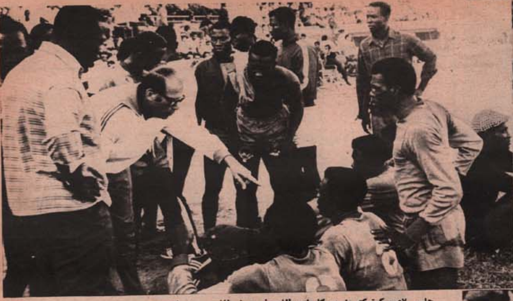
جلس لاعب كوتوكو يشرب كأساً من اللبن وسط الملعب ويشاهد مدرب فريقه يلقي عليهم النصائح . غاف كوتوكو من السحر فلم يدخل حجرة الملابس