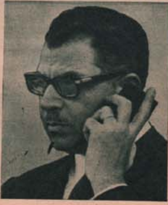
د . مصطفى كمال طلبة

معمونة فنية ستقدمها وزارة الشباب الى الاندية على شكل موظفين .. الوزارة بها ٥٦٠٠ موظف يتقاضون مليوناً و ٧٥٠ الف جنيه يقومون بتنفيذ خطة رياضية وشبابية قيمتها ٤٠٠ الف جنيه .. اي ان الوزارة تنفق ٨٠٪ لتنفيذ ٢٠٪ .. اعلان هذا الدكتور مصطفى كمال طلبة وزير الشباب في اجتماعه برؤساء الاقسام الرياضية بالجرائد والمجلات .. اعدت الوزارة سياسة قومية للشباب ستعلن بعد موافقة مجلس الوزراء عليها .. كما ستبدأ في اعداد سياسة قومية للرياضة تنفذ بعد الموافقة عليها ..