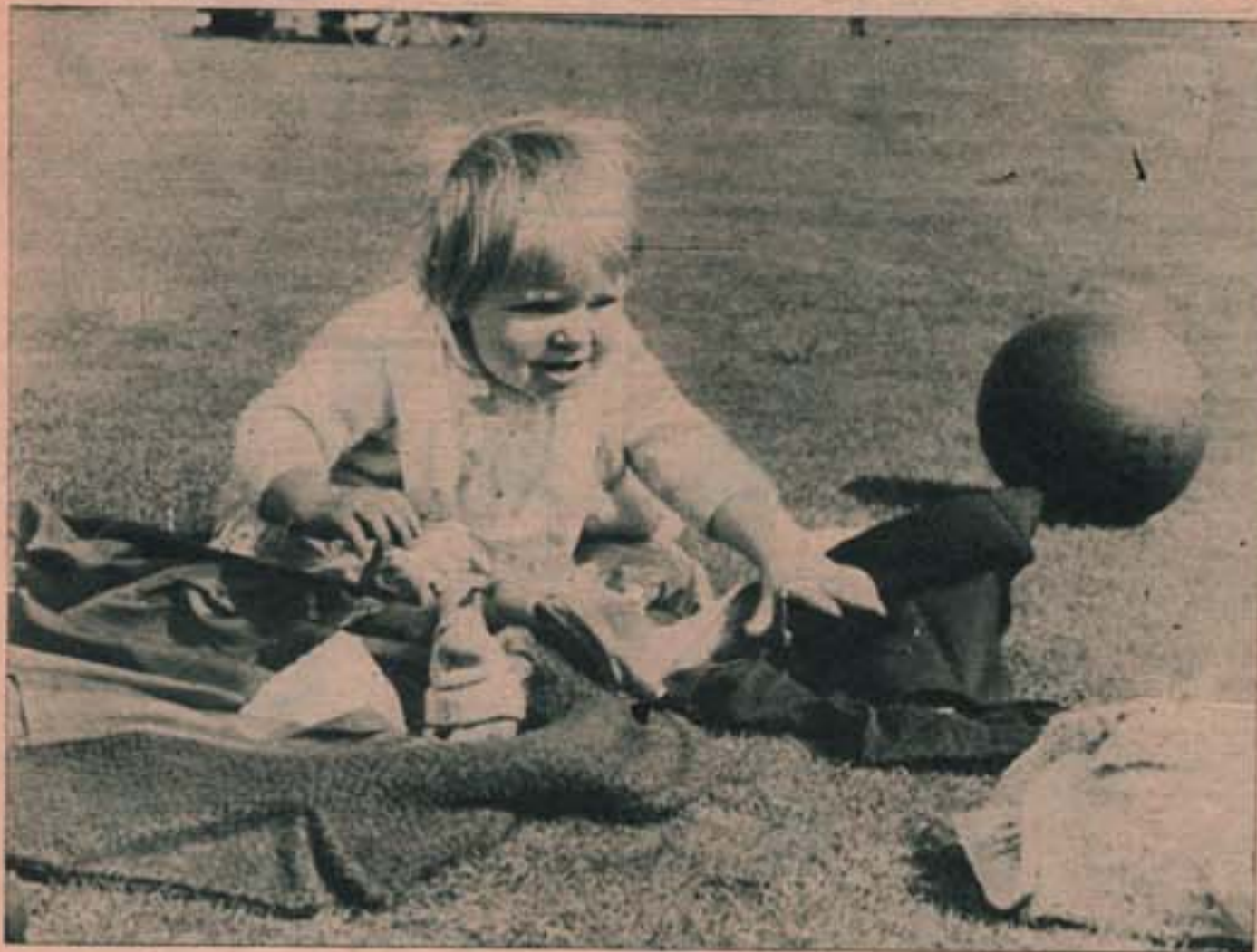
من أجل أن يزاول اولادنا الرياضة