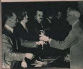
المهندس مشهور أمريشوبير يكرم لقيادة لاسرعيان

العاملون جميع قطاعات لخدمة قناة السويس وشركاتها وقد كرسهم الدولة كمؤسسة الإنتاج للجنة الرابعة على الترتيب