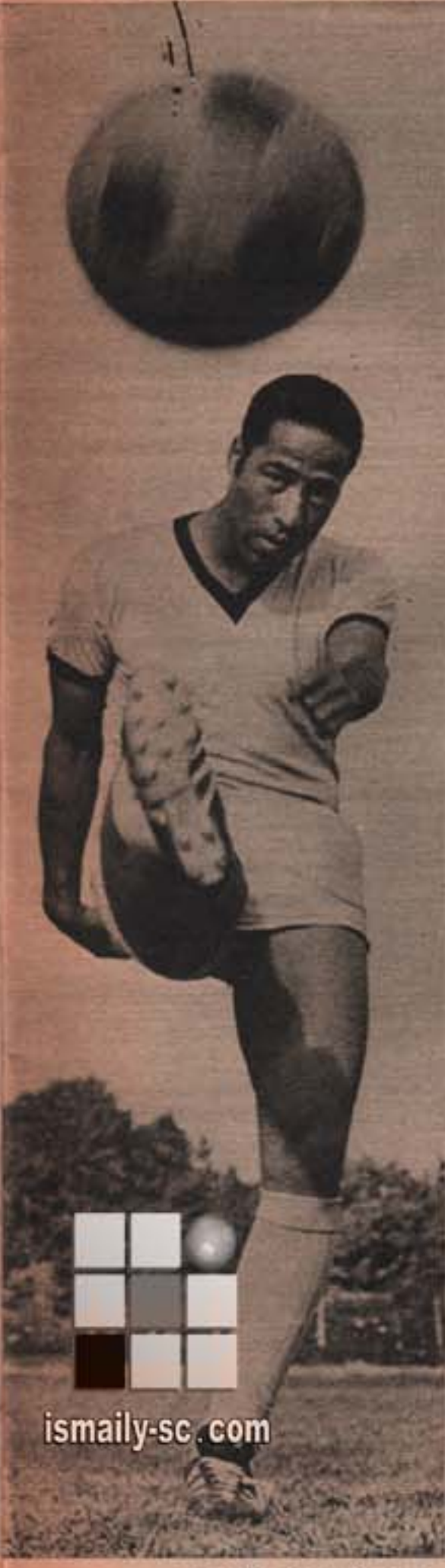
جودة يتدرب على التصوير بقوة وامسك الكرة

يوم ٤ ديسمبر القادم .. يعتبر من اهم الايام في تاريخ النادي الاسماعيلي .. انه موعد اللقاء الاول بين فريق النادي الاسماعيلي بطل اندية افريقيا .. والفائز من « كوتوجو » بطل غانا ويانج افريكانز بطل تنزانيا بعد مباراتهما التي ستقام يوم ٢٢ نوفمبر الحالي .. وهذا اللقاء الذي سيكون باسناد القاهرة بين الاسماعيلي والفائز من غانا او تنزانيا في الدور قبل النهائي لبطولة اندية افريقيا لكرة القدم .. ان هذا اليوم ليذكرنا باليوم التاريخي الكبير « يوم ٩ يناير من هذا العام عندما فاز الاسماعيلي على ارض سقاه القاهرة ببطولة اندية افريقيا وحصل على الكاس لأول مرة .. فمأنا أعيد الاسماعيلي للاحتفاظ بهذه الكاس والفوز بها للجمهورية العربية للمرة الثانية ؟