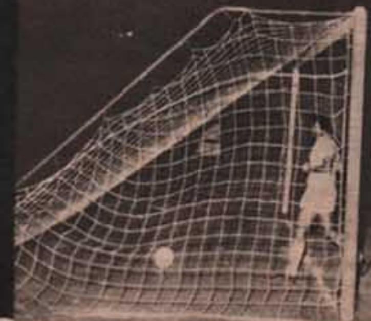
مجموعة لقطات من مباراة اهلى القاهرة واهلى بنى غازى واهلى حلب ..