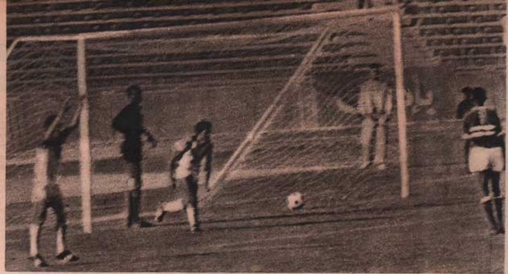
الحملوي بعد تسجيل الهدف ينهض فرحاً وحارس مرمى الهلال في حالة حزن