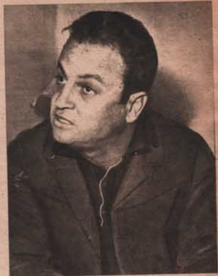
بين الاتهام والدفاع عن النفس

● وفي الختام ادجو ان تكون ردود الوحش مقنعة وان تصحح النقط على الحروفها امام الجميع