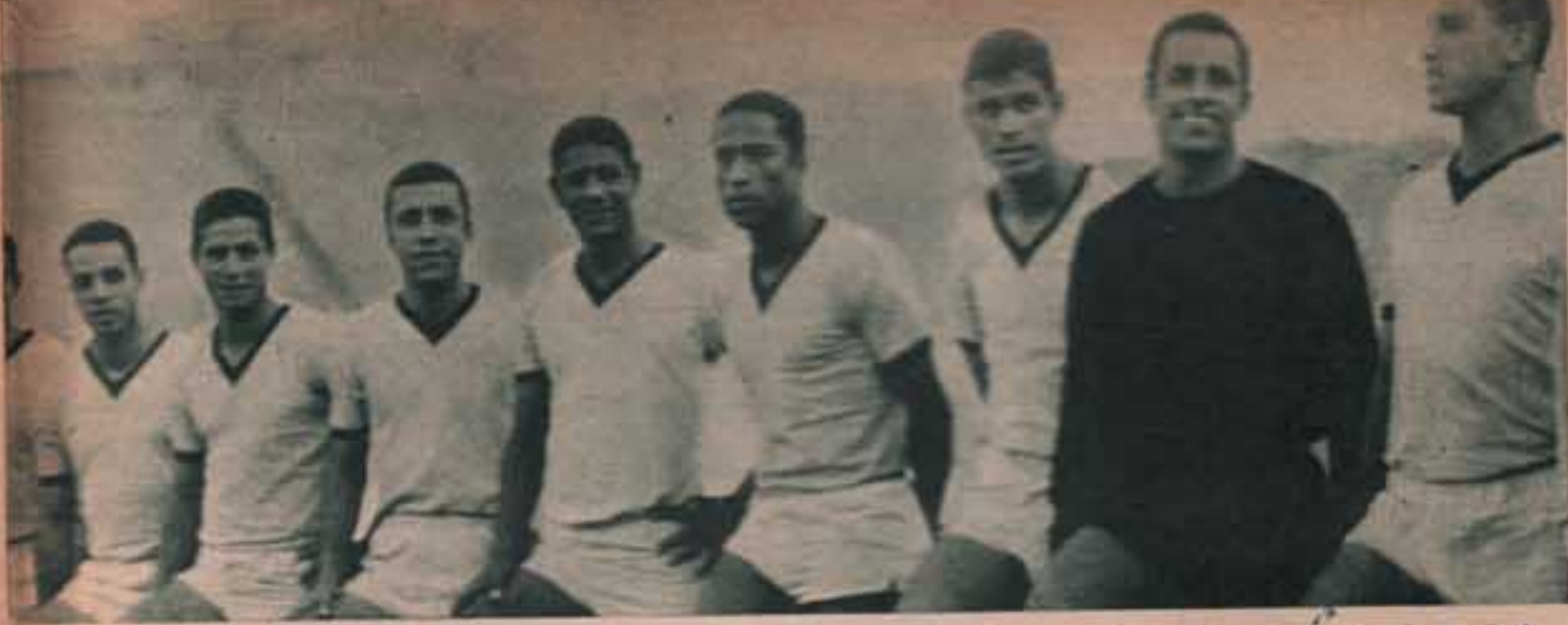
فريق الاسماعيلي الذي سيلعب انجليز يوم الجمعة